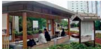
屋根があるので、雪の日でも入れます

1999年4月にオープンした「しかべ間歇泉公園」は、何といっても約10分間隔で噴き出す約100℃の間歇泉が有名。眺望の館2Fからは間歇泉を上から見ることが出来るほか、冬の秀峰駒ヶ岳も望めます。 住 茅部郡鹿部町字鹿部18-1 ☎01372-7-5655 営業 冬期：9:00～17:00、夏期：8:30～18:00 休 11～4月：毎月第4月曜日(祝日が月曜日の際は翌々日)、12/31～1/5、5～10月は無休 料 大人300円、小人(小・中学生)200円、幼児無料、団体割引有り ☎744 400 093*51 WC P 禁煙