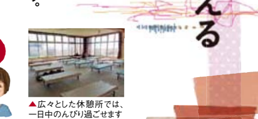
▲広々とした休憩所では、一日のんびり過ごせます