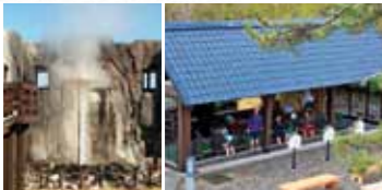
最大15m以上にもなる間歇泉は圧巻(左)、神経痛や冷え性などに効果抜群の足湯(右)