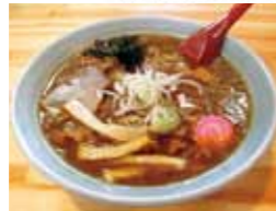
冬でも汗だくをお約束します