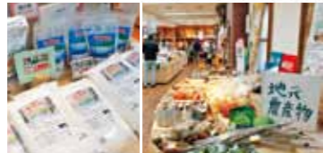
人気の摩周そばや定番土産の大鵬せんべい地元アーティストの作品を販売しています