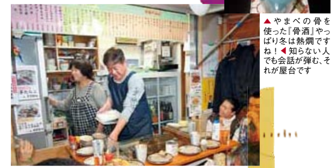
▲やまべの骨を使った『骨酒』やっばり冬は熱燗ですね！ ◆知らない人でも会話が弾む、それが屋台です