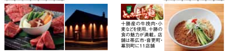
暖かい灯りが溢れる、焼肉KAGURA(右)、柔らかく臭みがないのが特徴の「未来めわろし」の特選盛り合わせ(左)