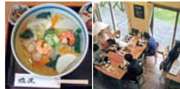
見た目も美味しい「海鮮塩うどん」。あっさりした塩味が好評(左)、お家で食べているような気分になる落ち着いた雰囲気店内(右)