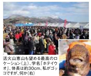
活火山恵山も望める最高のロケーション(上)、学名「ホテイウオ」、体長は約30cm、私がゴッコですが、何か(右)

住 函館市日ノ浜町 道の駅「なとわえさん」横特設会場～恵山海浜公園～ ☎0138-85-2336(函館市恵山支所産業建設課) 営業 2012年2/12(日) 予定 11:00～13:00 料 入場無料 ☎582 417 291 ※開催日時・会場・内容は変更の可能性があります