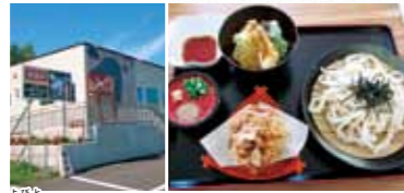
呼人からちょっと入ったところにあります(左)、冷やしうどんとミニ天丼+きたむらさき揚げのセット(1,080円)(右)