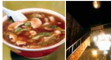
古き良き「お酒」の場で…ラーメンを食べる！