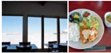
店内からは流水の接岸を見ることができます(左)、ランチ:900円(右)