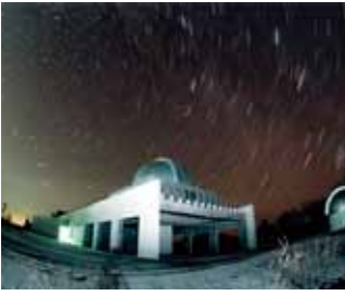
その美しさをここに近く現地でも味わって！

一般公開の天文台では日本最大級の反射望遠鏡を有する「銀河の森天文台」。望遠鏡をのぞくだけでなく、ぜひともスタッフに声をかけていただきたい。宇宙スケールの非日常的な話が日常的に聞ける貴重な空間です。隣接する「銀河の森コテージ」で宿泊すれば一晩中夜空に包まれます。