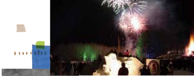
▲大きな見所「雪原の花火」

ぎで、第2回の開催から寒中キャンプを敢行。今では「人間耐寒テスト」と呼ばれる夜を徹した「しばれ」との共存(戦い?)を試みる驚嘆の企画をメインとして、期間中に二万人の人が訪れる一大イベントにまで成長した。約三千人の町に二万人が集まる。山間部のまちで、これほど元気に「まちのイベント」を企画し、住民だけでなく、よそのまちの人まで巻き込んで、これほど大きな成長を見せた例は決して多くない。そして、その背景にある工夫と苦労は決して少なくない。全ては地域の人の明るさと、無性に熱い気持ちで前に進んできたのだ。夜空に浮かぶ雪中花火を見上げながら、そんな感慨に想いふけることも、醍醐味なのかも知れない。しばれ、具合に余裕があればの話ですが…。