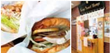
ほかにも、摩周ポークのしょうが焼き丼や温かい摩周そばなどのメニューも充実