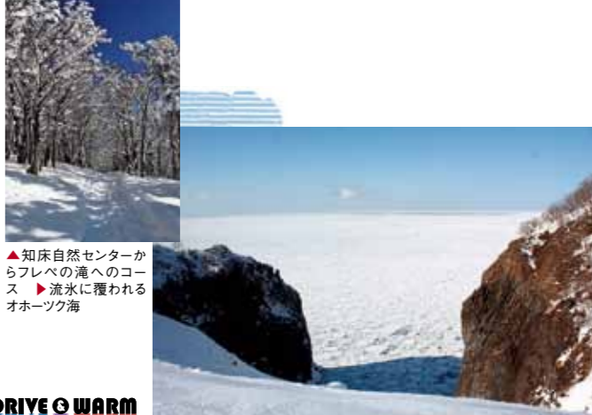
▲知床自然センターからフレレの滝へのコース ▶流水に覆われるオホーツク海