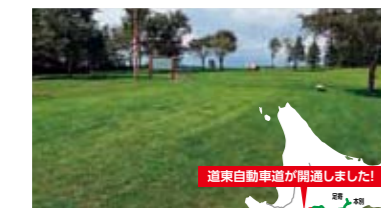
道東自動車道が開通しました! 道東自動車道 「十勝平原サービスエリア」 十勝らしい景色が見られます