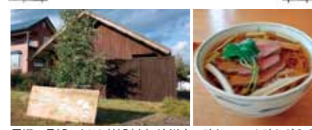
周辺の景観になじむ外観(左)、滝川産の鴨をつかった鴨ねぎそば。素材本来の味が冷えた身体を温めてくれる(右)