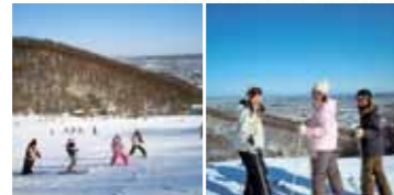
緩やかな傾斜の「ファミリーゲレンデ」(左)、コブ&急斜面が特徴の「ダイナミックコース」からは札幌の街並みを一望できます(右)

住 札幌市南区篠舞1-5-5-41 ☎011-596-5994 営業 11:15~14:30、17:00~20:00 休 火曜日、第2・3月曜日※月曜日が祝日の際は営業 料 うどん単品(630円〜)、定食(1,050円〜)ほか ※お子様うどんもご用意しています 〒9 151 231*01