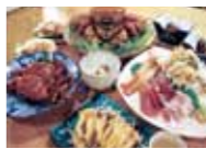
▲新鮮な海の幸を使った見事な料理