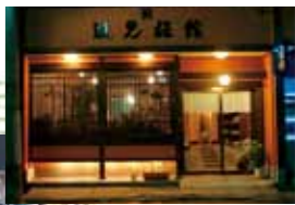
▲和の趣きを感じられる旅館入口。スロープもあり車いすでも安心 ▲辺見旅館女将