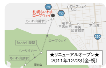
札幌もいわ山ロープウェイ・もいわ山展望台①

住 札幌市南区藻岩下1991 ☎011-581-2518 営業 2011年12月中旬~2012年3/31(土) 月~金 9:00~21:00 【土日祝・冬休み期間中】8:30~21:00【ナイター】16:00~21:00 休 期間中無休 料 リフト料金(一般1回券)大人300円、子ども220円 【7時間券】大人・子ども共通3,200円 など ☎9 340 192*76