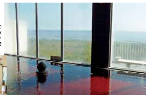
透き通った琥珀色のとっても濃いお湯。▼家庭でも温泉を楽しめる「美人晩成」シリーズ。小袋入浴剤はなんと60円!

まずは体を温めよう 帯広駅から車で約1時間10分、太平洋を望む海沿いに晩成温泉①があります。十勝管内で太平洋を望める温泉は晩成温泉だけ。澄み切った海と空の青、海に浮かぶ満月、満点の星空...その眺めの良さもさることながら、ここの温泉、体がとっても温まるんです! その理由はヨード。晩成温泉は日本で有数の濃度を誇る「ヨード泉」なのです。消毒薬にも使われるヨードは殺菌効果や保温効果が高いのだそう。温泉に通う地域の方たちからは「ここの温泉に入っていると風邪ひとつ引かないよ」との声も。また、近くの海跡湖