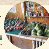
朝もぎ野菜などが並ぶ直売所